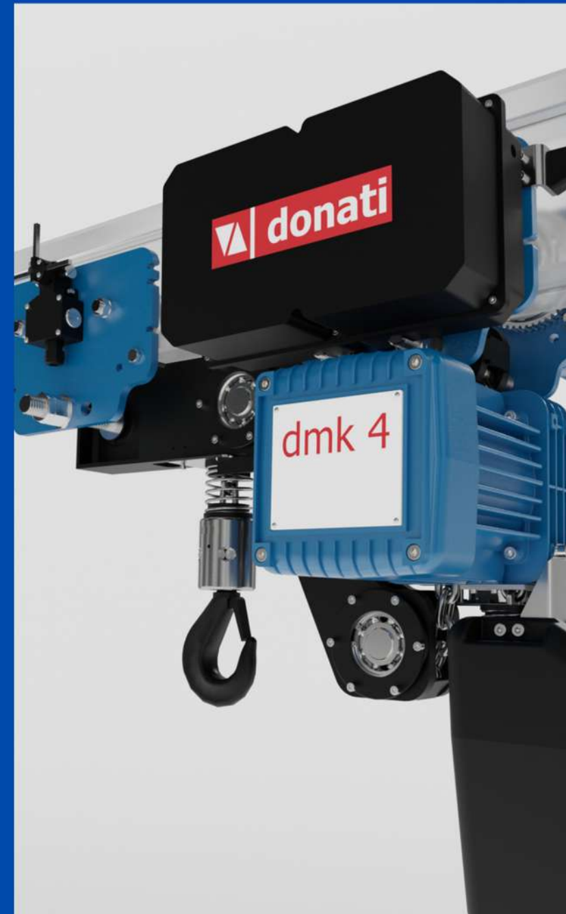
POLIPASTOS / TECLES

Somos representantes oficiales y distribuidores autorizados de DONATI, marca reconocida mundialmente por su calidad, tecnología y confiabilidad en sistemas de izaje.